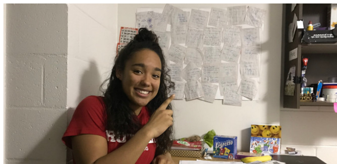
Tekst / Foto's: Tanisha Franke